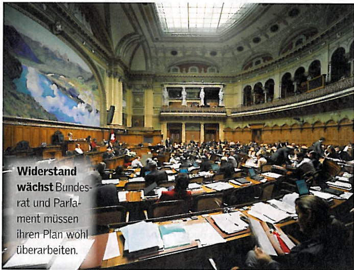
Widerstand wächst Bundesrat und Parlament müssen ihren Plan wohl überarbeiten.