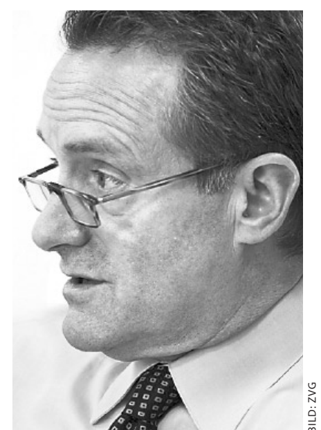
Howard Marks: «Gold ist eine Religion. Eine intelligente Investition ist nicht möglich.»

Ein ambivalentes Verhältnis hat Marks zu Gold. Steht das Edelmetall in einer Blase? «Gold hat keinen fairen Preis, weil es keinen Cashflow abwirft. Es kann aus Sicht eines Investors nicht analysiert werden.» Gold sei im Grunde genommen eine Religion. Man glaube daran oder man glaube nicht daran. Gold diene als Wertaufbewahrungsmittel und als Inflationsschutz. Dafür gebe es keine intellektuell greifbare Begründung, meint Marks, aber diese Attribute hätten sich als allgemein anerkannt etabliert. «Bloss: Diese Rolle, so glauben die Gläubigen, nimmt Gold heute zu einem Preis von 1300 $ je Unze wahr. Was ist, wenn der Preis auf 3000 $ steigt?