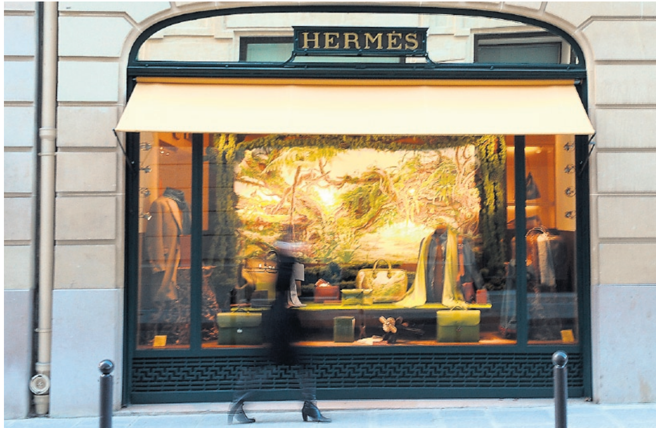
Der renommierte Luxusgüterhersteller Hermès hat viele Bewunderer, offenkundig auch im Kreis der Konkurrenten.

Allerdings hat der Tod des früheren Präsidenten Jean-Louis Dumas im Mai Spekulationen ausgelöst, dass die Einigkeit der Erben bröckeln könnte. Die Aktien von Hermès avancierten seither über 90%. Nach der Ankündigung von LVMH stiegen die Notierungen am Montag erneut 15,2% auf 202,85 € (vgl. Börsenbericht auf Seite 9). Dennoch hat LVMH-Chef Arnault nach eigenen Angaben im Schnitt nur 80 € pro Aktie gezahlt; auf diesem Niveau notierten Hermès zuletzt im Mai 2009. Deshalb rätseln Händler, wie Arnault das Engagement